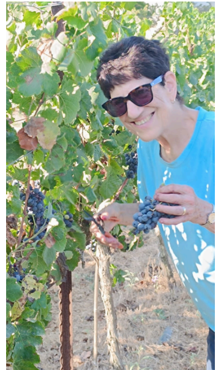
להתנדבות ולהאבת הטבע - אין גיל