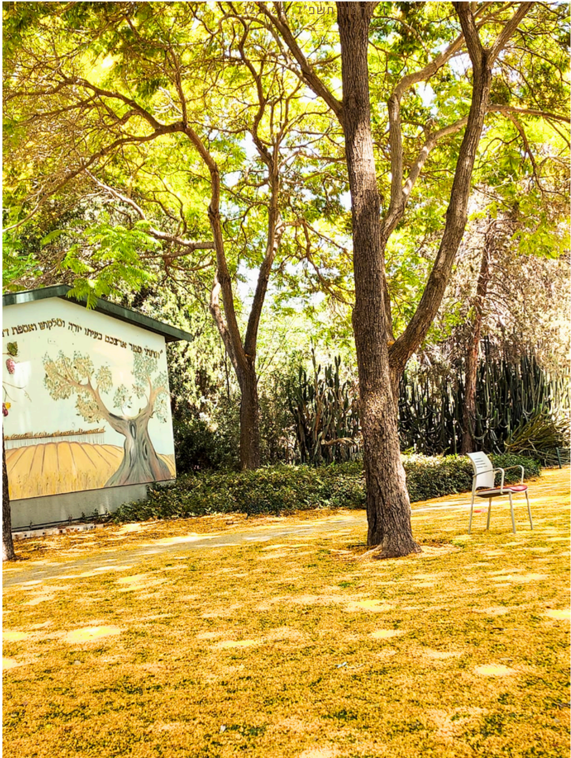
מרבדים לרגלי עץ השלטית המקומטת (platform)