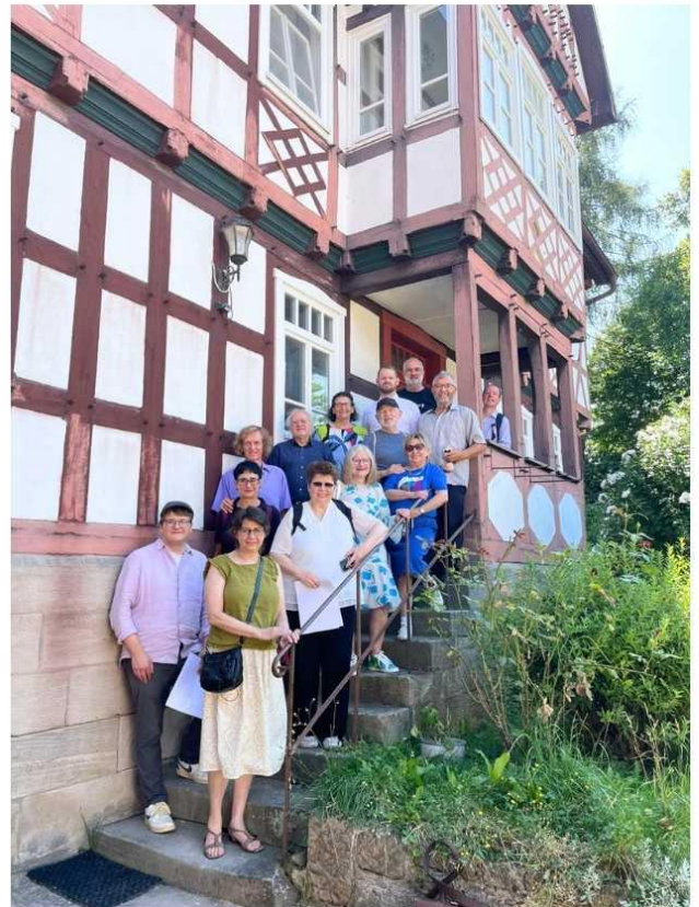
צילום על המדרגות של רודגס, מחווה לצילום ישן של המייסדים על אותן המדרגות.