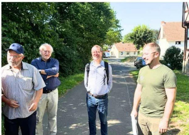
במרכז - הרופא שרכש את חוות רודגס

“הרי אני כבן שבעים שנה”, וזכיתי לראשונה להיות ברודגס המקורית והאמיתית, ולהכיר מקרוב וקצת יותר טוב את השורשים של כולנו.