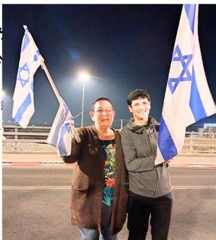
בשבוע המטלטל הזה כ-20 איש מיבנה התקשו להישאר בביתם ויצאו לצומת.