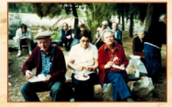
בקעת הירדן, 1991

מחזור 5: 18-20.2.25 ("כ"ב שבט) ימים ג'-ה'