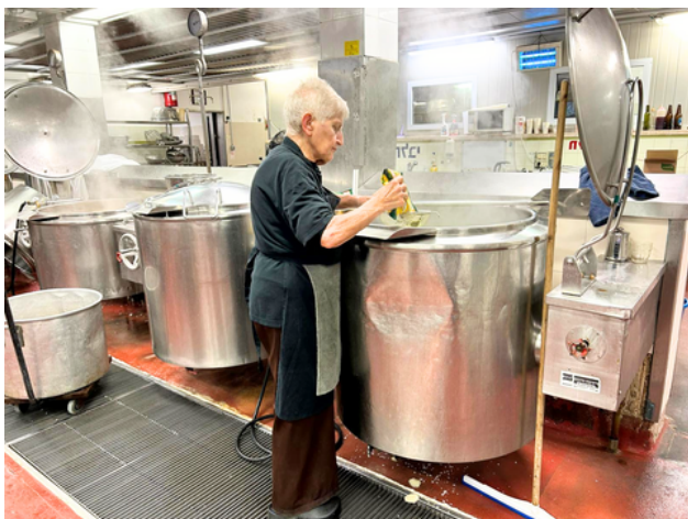
אלקה בישלה מרק, נתנה לזה ולזה ולכולם נשאר.