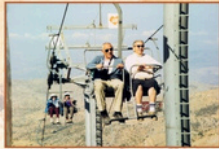
רמת הגולן, 2000

מחזור 6: 24-26.2.25 ("ו-כ"ח שבט) ימים ב'-ד'