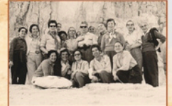
עין גדי, 1972

מחזור 3: 3-5.2.25 ("ה'ז' שבט) ימים ב'-ד'