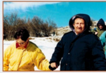
רמת הגולן, 2000

מחזור 1: 19-21.1.25 ("ט-כ"א טבת) ימים א'-ג'