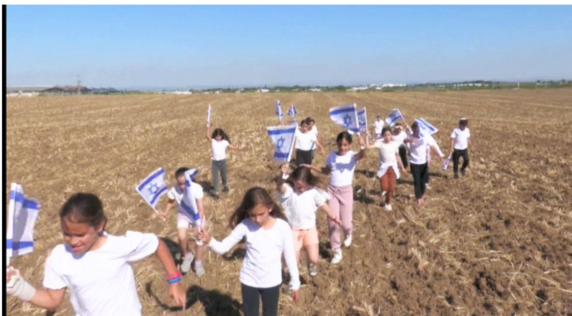
תמונה מתוך הקליפ

בסיום הערב אמר לי אחד החברים: "בזכות הערב הזה אני מרגיש שאפשר להרים את הראש. אפשר לנשום" הלואי וניזכה במהרה, להפריח בלונים לבנים במקום צהובים, בשובם של חיילנו בריאים ושלמים, שהצפון והדרום יחזרו לשגשג ושנחזור לנשום, בשמחה.