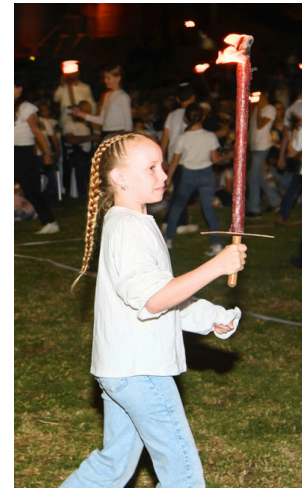
את הצילומים מערב המפקד צילם זהר ברטוב