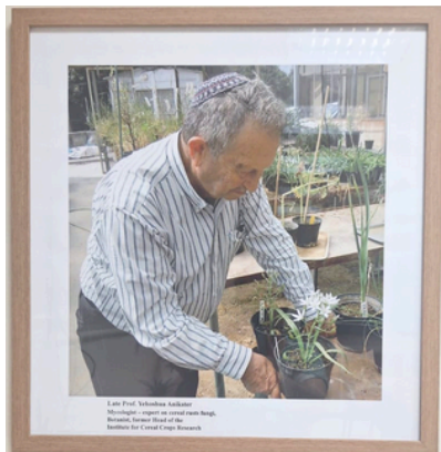
אחת התמונות שנתלו על הקיר של חדר הישיבות בעת האירוע.