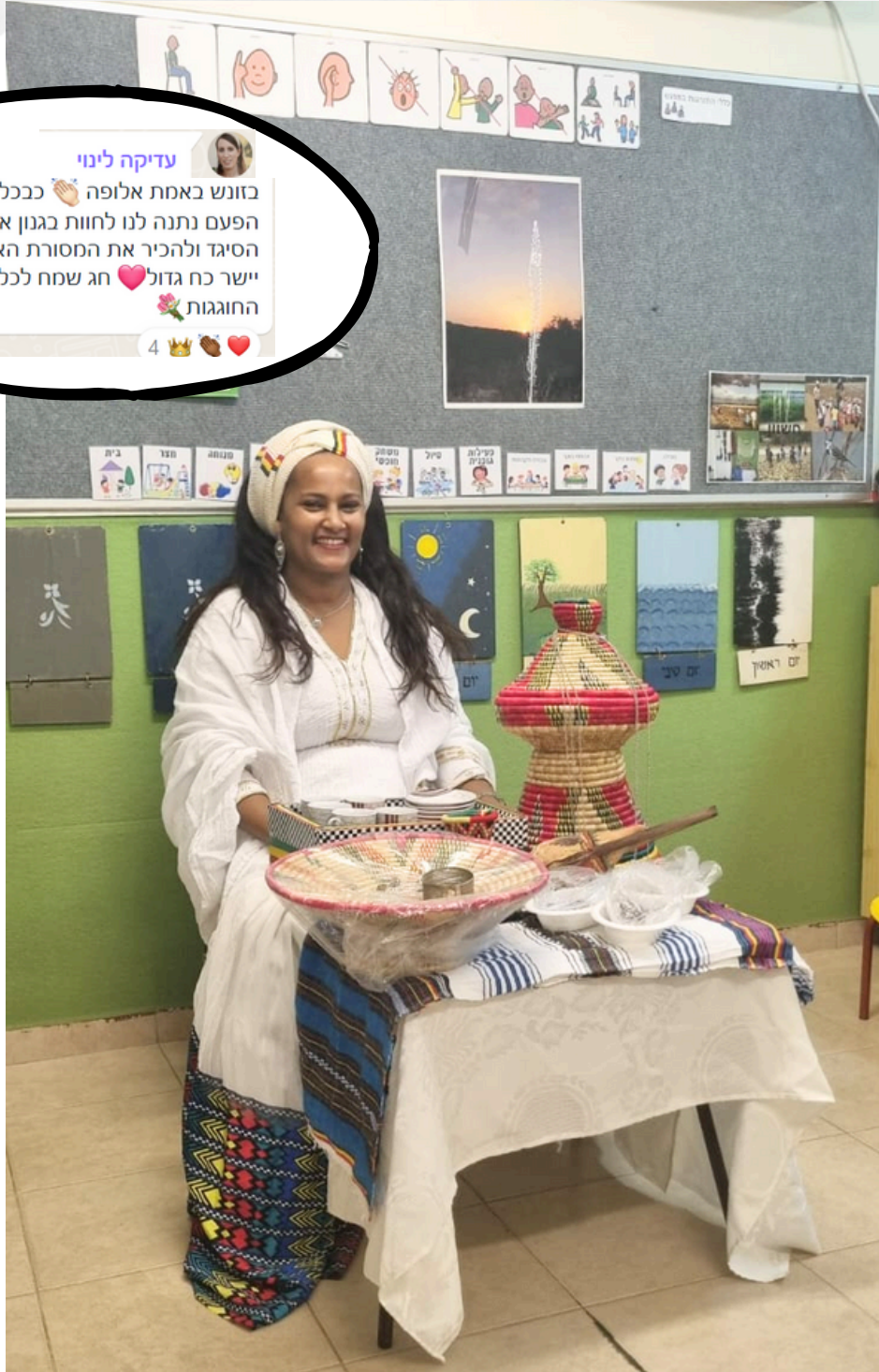
חג הסיגד בגנון דקל. פרטים בעמוד הבא.