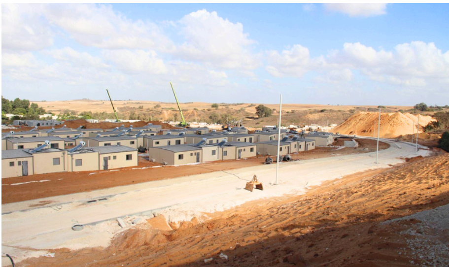
שכונת הקרווילות של אנשי כפר עזה בקיבוץ רוחמה

המשימות רבות מאד, הצרכים גם. כולנו יכולים לעזור במשהו, לתת יד, וממילא - כבר לפתוח ת'לב. עקבו אחרי ההודעות המתפרצות בקבוצת הוואטסאפ. ואם אתם עדיין לא הצטרפתם אליה - זה הזמן.